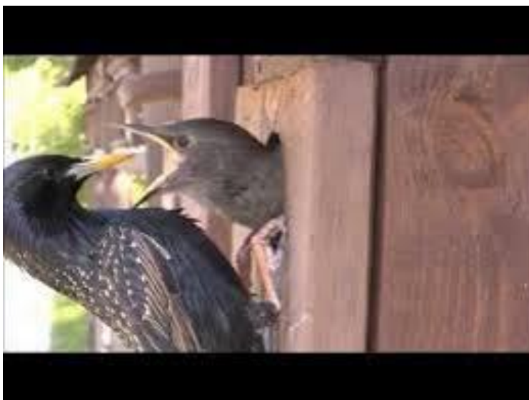
Szpak karmiący pisklę

Dziecko omawia wygląd szpaka (pióra mieniące się kolorami tęczy, z brązowymi kreskami).